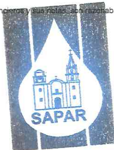
Sistema de Agua Potable y Alcantarillado de Romita, Gto.