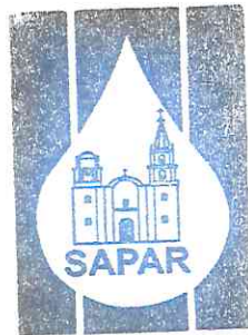
Sistema de Agua Potable y Alcantarillado de Romita, Gto.