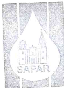
Sistema de Agua Potable y Alcantarillado de Romita, Gto